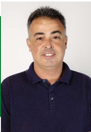
José Roberto Fonseca, Zé Roberto