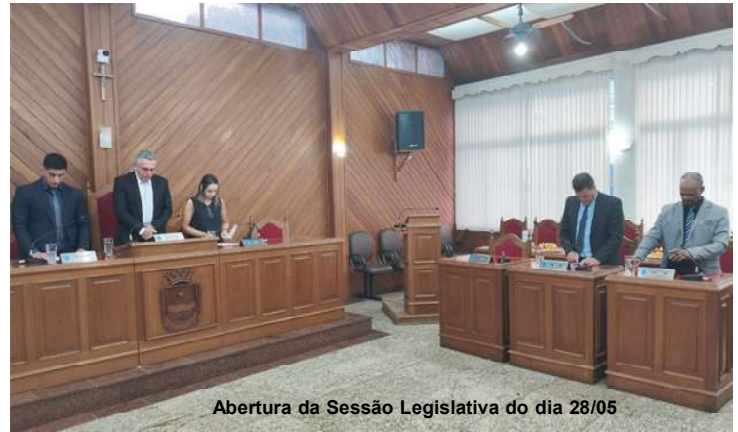
Abertura da Sessão Legislativa do dia 28/05

de convênio firmado entre o Município e o MAPA (Ministério da Agricultura e Pecuária), e serão utilizados para aquisição de uma retroescavadeira para o Projeto de Aquisição de Máquinas para o Programa Municipal Patrulha Agrícola.