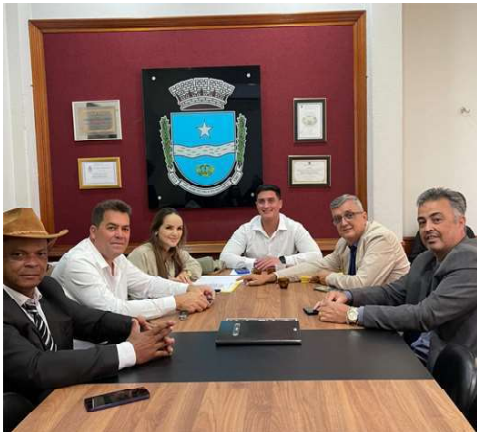
Reunião das Comissões Permanentes dia 26/05

Recepcionado no último dia 21 de maio, o Projeto de Lei nº 996/26, após receber parecer técnico positivo da Procuradoria Jurídica da Câmara no dia 26, foi encaminhado na mesma data às Comissões Perma-